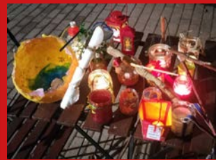
Natale 2024. 5 giorni di festa per bambini e genitori della Scuola dell'infanzia PINI