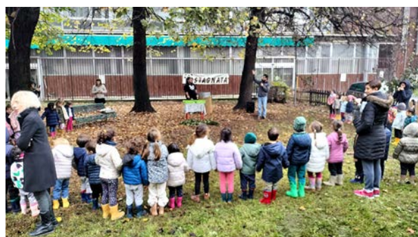
venerdì 8 novembre, scuola CRESCENZAGO