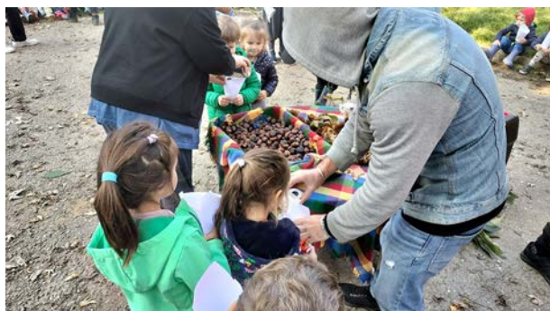
Lunedì 4 e mercoledì 6 novembre, scuola PINI

Si è conclusa venerdì la CASTAGNATA per le scuole dell'infanzia dei nostri quartieri. Abbiamo illustrato i temi legati alle castagne (piante, ricci, raccolte, cottura) e distribuito caldarroste a 570 bambine e bambini e alle maestre delle classi. Siamo contenti e lavoreremo per concretizzare altre iniziative da portare nelle scuole.