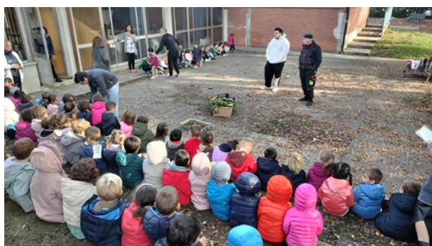
martedì 5 novembre, scuola CLERICETTI