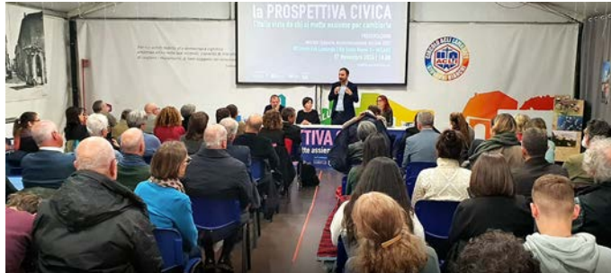
Intervento di Emiliano Manfredonia, Presidente Nazionale ACLI

La ricerca si è basata su due anni di studio e include contributi di ventiquattro autori , arricchiti da statistiche inedite e da una mappatura della partecipazione civica in Italia . A differenza dei precedenti rapporti, che si focalizzavano sull'impatto sociale e culturale delle associazioni, La prospettiva civica si propone di esaminare il funzionamento interno delle nuove realtà associative e le motivazioni di coloro che scelgono di impegnarsi attivamente, spesso in modo informale, all'interno delle proprie comunità.